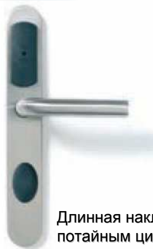
Длинная накладка с потайным цилиндром