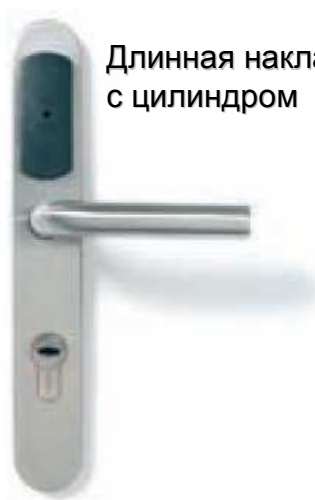
Длинная накладка с цилиндром