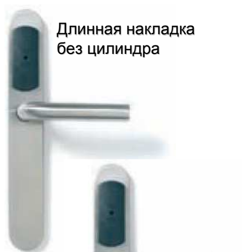
Длинная накладка без цилиндра