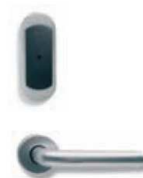
Короткая накладка без цилиндра