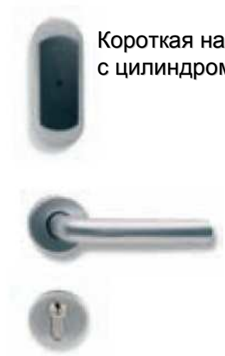
Короткая накладка с цилиндром